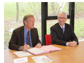
Signature du contrat groupe de l'assurance statutaire - 26 novembre 2009 -